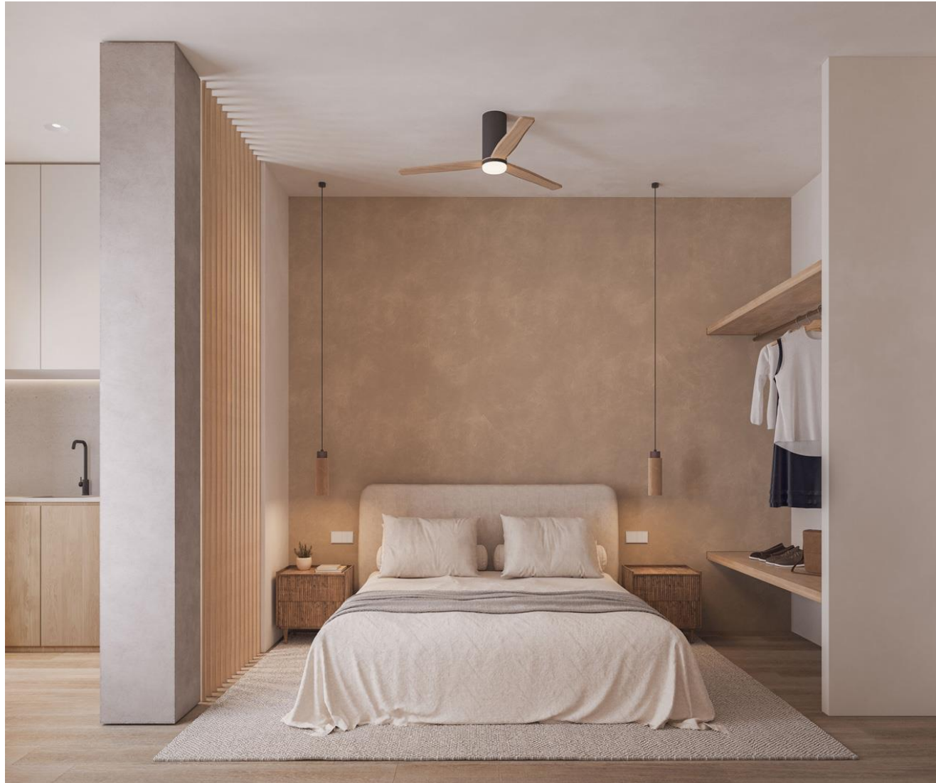
Recreación 3D del mobiliario y decoración que se instalará.