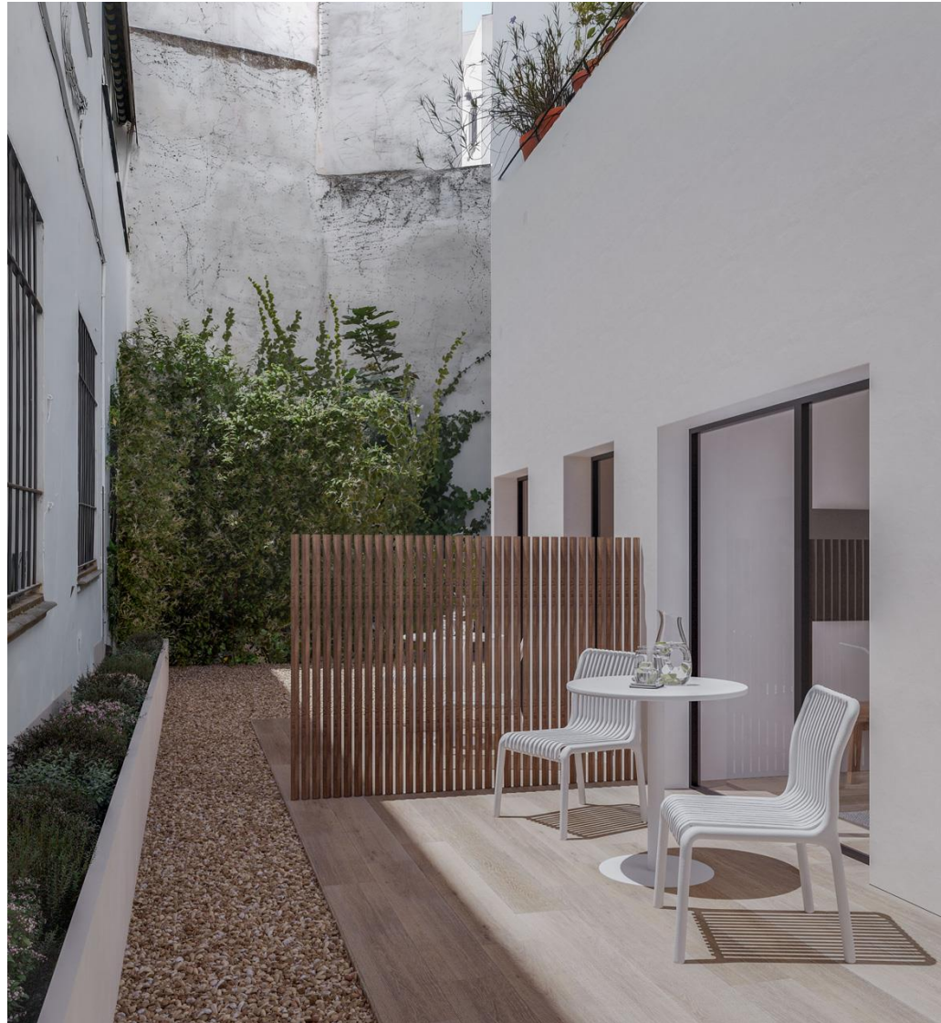
Recreación 3D del mobiliario y decoración que se instalará.