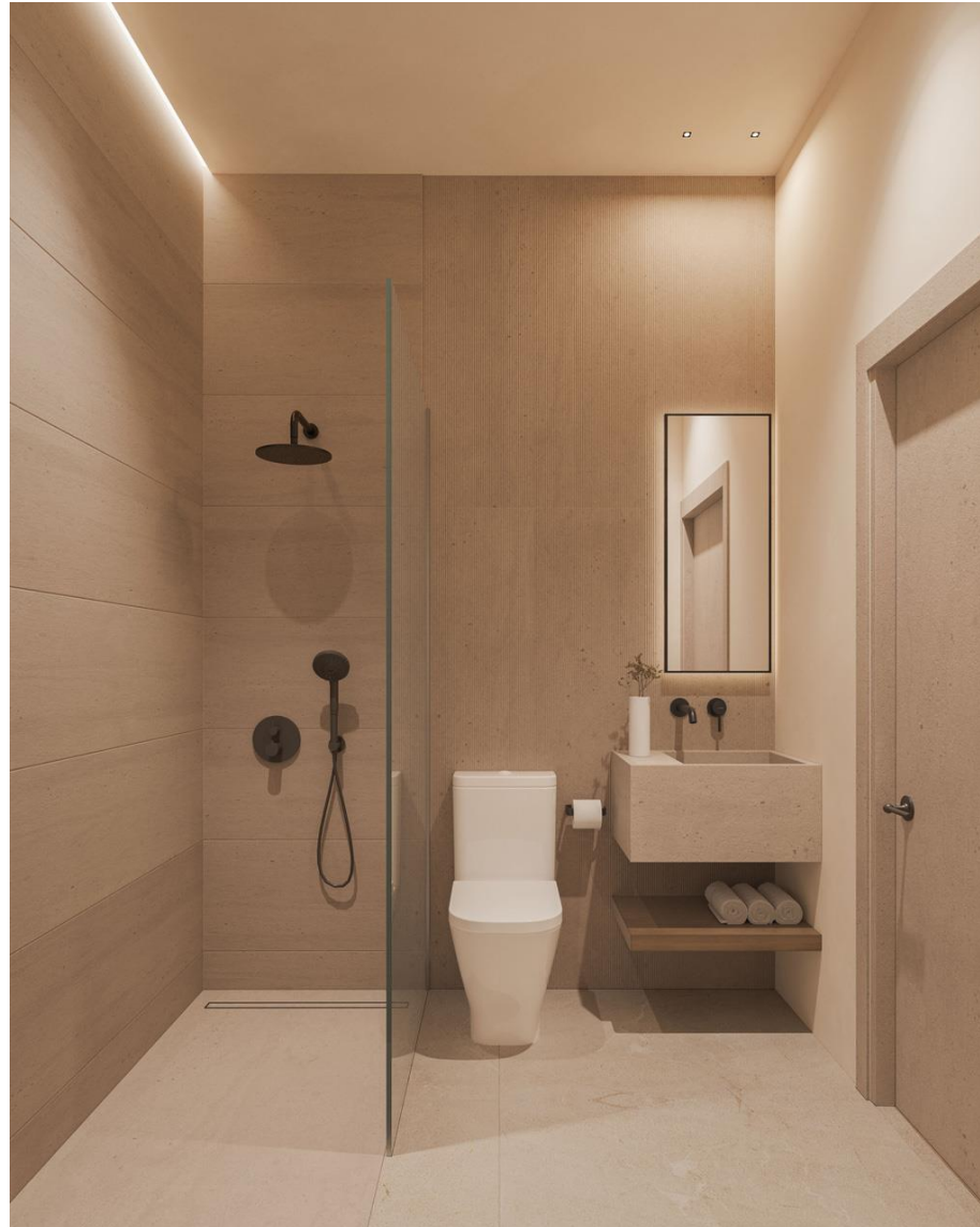
Recreación 3D del mobiliario y decoración que se instalará.