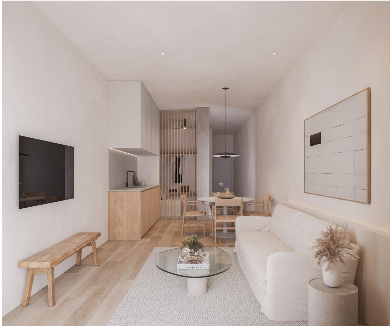
Recreación 3D del mobiliario y decoración que se instalará.